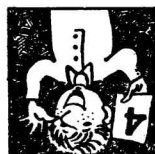
Рис. Л. РЯБИНИНА.